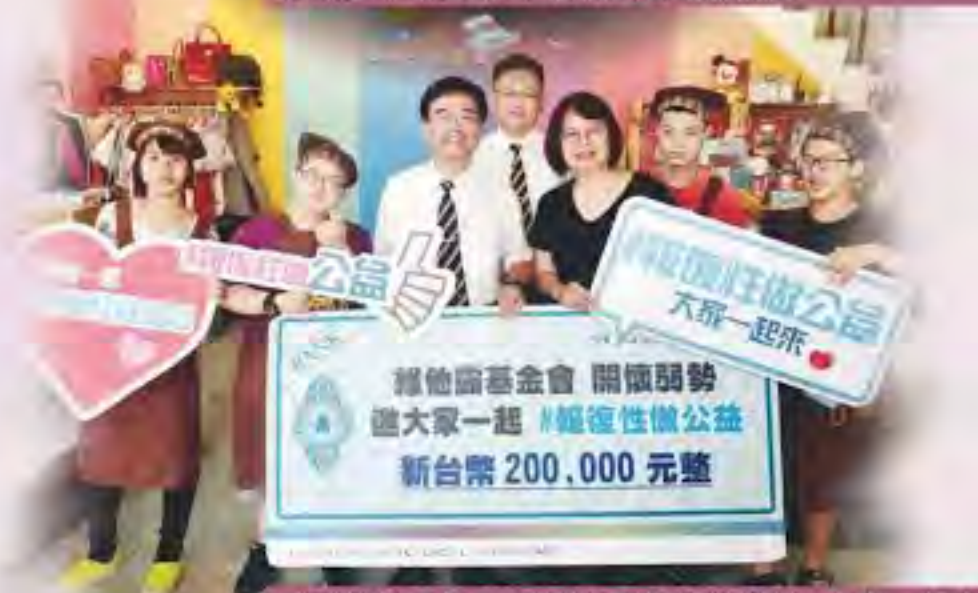
感謝維他露基金會捐款-報復性做公益-大家一起來