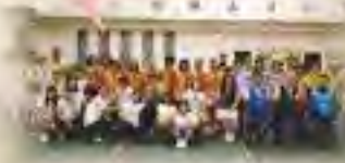
109年度身心障礙者暑期生活營活動成果發表

個人每個氛圍，真的很溫暖很團結，越是回想越是印象深刻，突然有些貴楚想回到時光，回到一開始相遇的地方，再一次感受大家，擁抱可愛的大家--