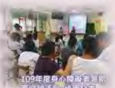
109年度身心障礙者暑期生活營戶外球類運動活動