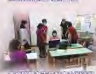
生活營團康茶會-咖啡茶區