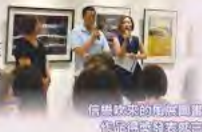
信譽致來的家庭照顧 作服務與社區感