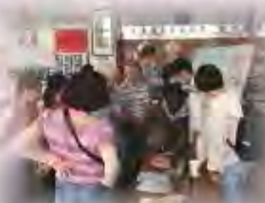
生活營團康茶會-咖啡茶區