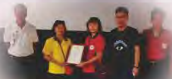
感謝臺中市愛幼會-提供愛心電影欣賞

臺中市政府警察局豐原分局率領豐原慈濟宮、葫蘆墩媽祖 樂天宮、豐原警友站、豐原武德宮財神廟 豐原白沙屯媽祖文化協進會等單位捐贈物資