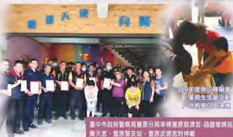
109年度身心障礙者 暑期生活營活動 戶外教學GPR演說

臺中市政府警察局豐原分局率領豐原慈濟宮、葫蘆墩媽祖 樂天宮、豐原警友站、豐原武德宮財神廟 豐原白沙屯媽祖文化協進會等單位捐贈物資