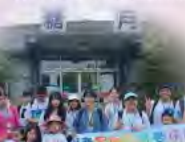
生活營團康茶會-咖啡茶區