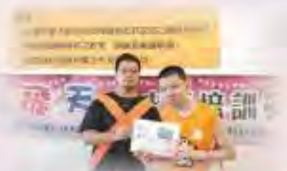
第七屆生之光繪畫徵選